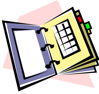
evenementen kalender 2011